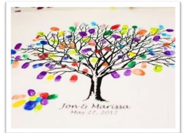
ゲストと創るウエディングツリーは一生の思い出に

ゲストを飽きさせない、オシャレでさりげないおもてなしを gensen weddingチームがカタチにします。