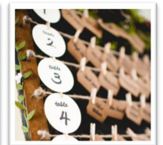
ゲストの名前とパーティ会場の座席を記したエスコートカード