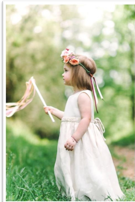
挙式退場はリボンワイズで華やかに キッズゲストも喜ぶ演出