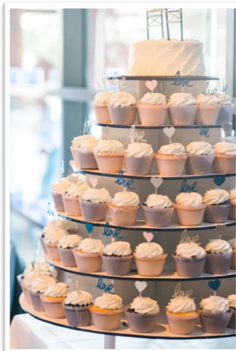
ウエディングケーキはカップケーキ ラッキードラジェを忍ばせて