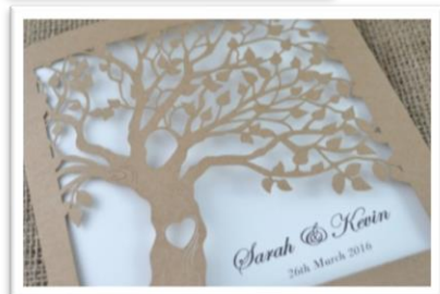
テーマカラーに合わせた ペーパーアイテム