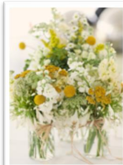
グリーンをベースに多肉植物やマーガレットで大人かわいく