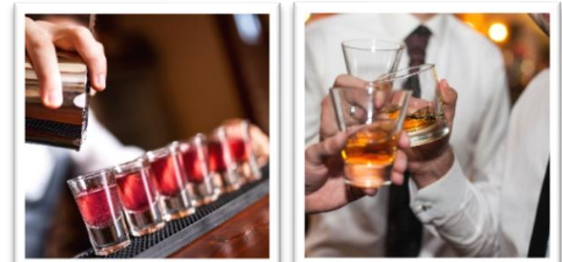
シェイカーやボトルが宙を舞い、会場は熱気に包まれ、 いつの間にかカクテルが完成 一体感が心地良い