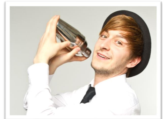
フレアSHOW。圧巻のパフォーマンスにゲストも大喜び

あたりは熱気と完成に包まれ、非日常の世界へESCAPE！ 年齢・性別を越えて会場を一体化できる gensen weddingチーム イチオシの演出。