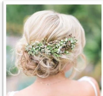
ヘアは緩やかに自然体なアレンジを かすみ草で柔かさを演出