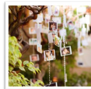
幼い頃の思い出をゲストと共有「Family Tree」