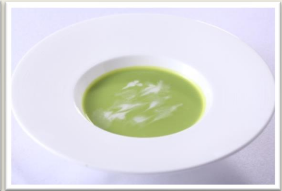
【ミドル】 季節野菜のポタージュ