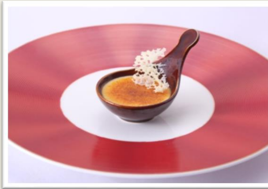
【アミューズ】 パルジャミーノのクレームブリュレ

シェフとの打合せで一皿ずつセレクトするプリフィックススタイル。 レストランの強みを活かした、ふたりだけのオリジナルメニューをご用意します。