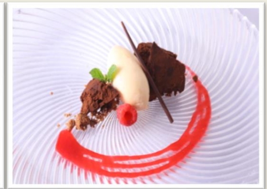
【デザート】 ガトーショコラと オレンジの香り豊かなコアントローのアイス