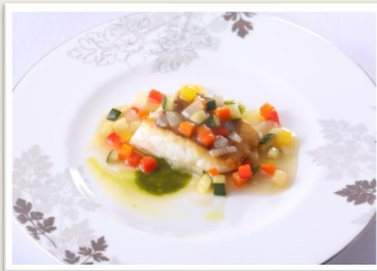
【魚料理】 真鯛のポワレ ハーブを纏った野菜のソース