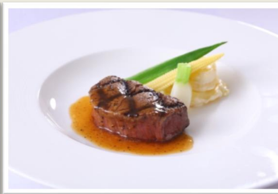
【肉料理】 国産黒毛和牛フィレグリル トリュフ香るマデラソース