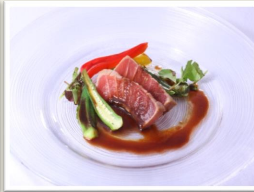
【前菜】 炙りマグロのレア仕立て 山椒香る赤ワインソース