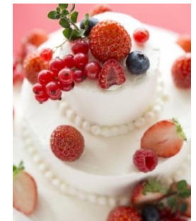
おばあ様からのラストバイトで みんなが笑顔