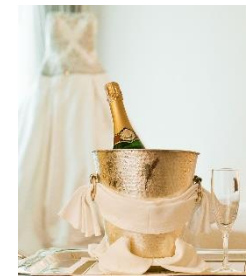
記念日やデート等、 いつでも帰ってこられるのも ホテルウエディングの魅力