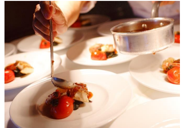
地元食材を使ったオリジナル料理を堪能

ファミリーウエディングだからこそ叶う、 背伸びしない おもてなしのカタチ「Sweet Family Wedding」