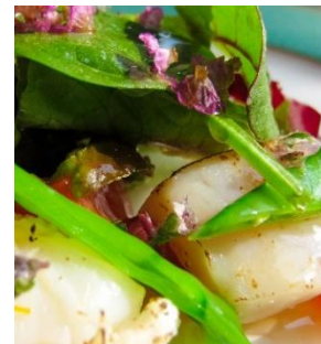
和のテイストを取り入れた ジャパニーズフレンチが人気